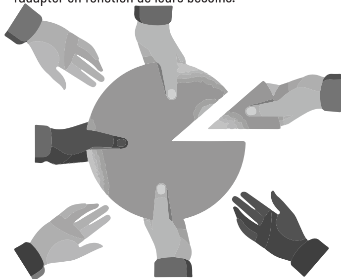
Illustration by Nathalie Lees - adapted

Il est important d'établir à l'avance les temps de chaque phase et de désigner une personne pour aider le groupe à les respecter. Nous suggérons ci-dessous une proposition des temps à attribuer à chacune des phases, mais les groupes peuvent l'adapter en fonction de leurs besoins.