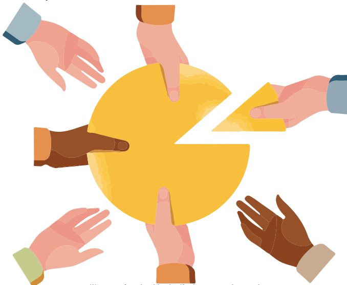
Illustration by Nathalie Lees - adapted

Il est important d'établir à l'avance les temps de chaque phase et de désigner une personne pour aider le groupe à les respecter. Nous suggérons ci-dessous une proposition des temps à attribuer à chacune des phases, mais les groupes peuvent l'adapter en fonction de leurs besoins.